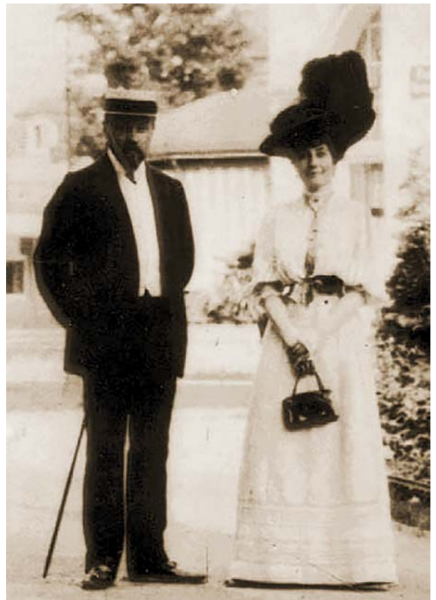
Nicholas y Helena Roerich (1908–1910)

“Chegaram em Nova York em 1921, por ocasião da Exposição de pinturas do Prof. Roerich em Nova York. Ele, o grande artista internacionalmente con-