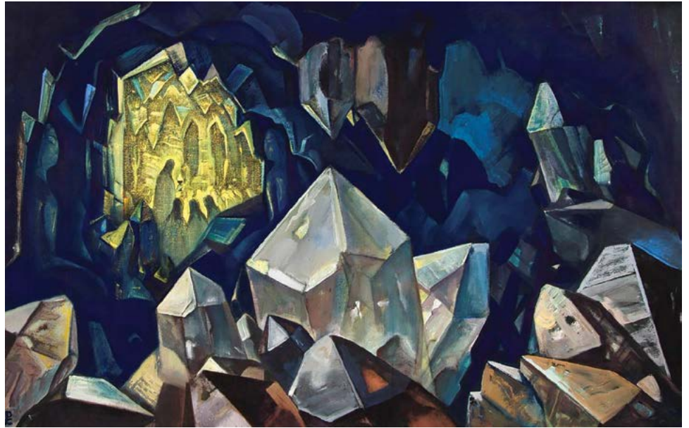
Tesoro Más Sagrado de la Montaña , Nicholas Roerich, 1933

sabedoria’- as grandes doutrinas da filosofia oriental para as mentes ocidentais, e ela foi perseguida, difamada, caluniada, não só por estranhos e inimigos, mas por aqueles muito chegados a ela. E os Roerichs também não escaparam desse destino. E, no entanto, todos esses exemplos ainda sim tiveram realizações- o Ensino transmitido permanece, ganha mais adeptos, traz expansão de consciência a cada vez mais, um maior número de pessoas, e acende novos corações com amor, compaixão, tolerância e desejo invencível de servir, com o fito de ajudar a elevar o espírito dos nossos semelhantes.