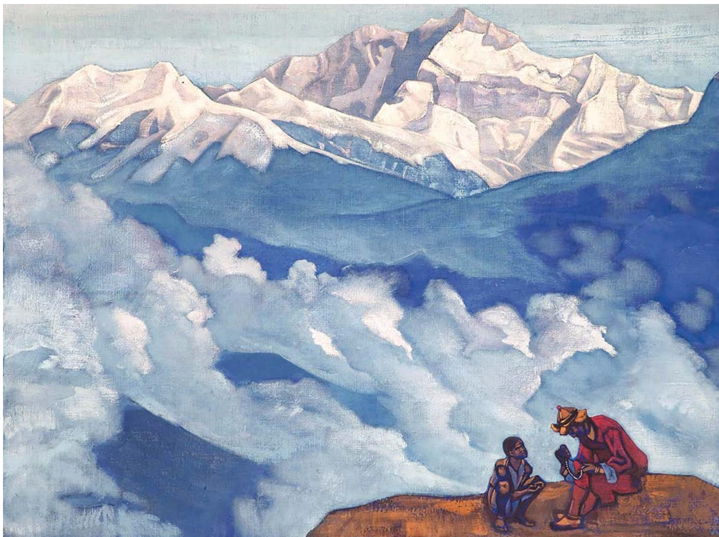
Perla de la Búsqueda , Nicholas Roerich, 1924

ais sérios e os seguidores de sua Grande Arte. Com eles, Prof. Roerich fundou uma Escola de Artes, chamada de Escola das Nações de Maestria em Artes. Posteriormente fundou o Museu Roerich, a Sociedade Agni Yoga, o Centro Internacional de Arte, e mais tarde o Comitê para o Pacto Roerich e a Bandeira da Paz. Assim foi colocada a pedra angular do mais profundo e a maior valorização da cultura na alma da América. Este foi um dos objetivos de sua grande Missão.